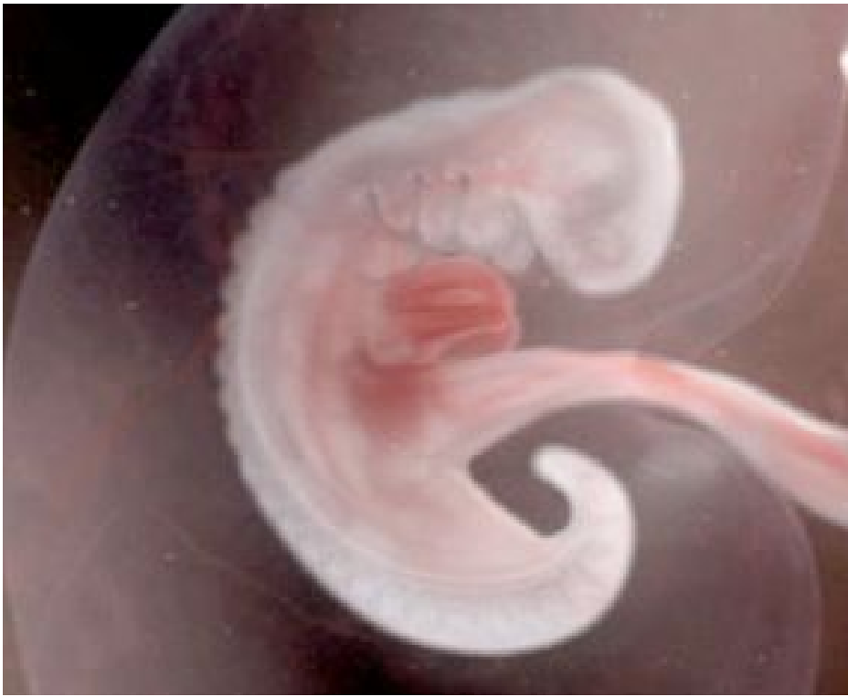
embryon à la 3e semaine de grossesse Taille : 1,5 à 2 mm.